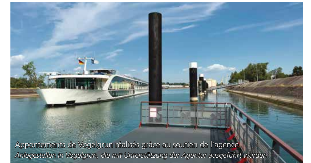
Appontements de Vogelgrun réalisés grâce au soutien de l'agence Anlegestellen in Vogelgrun, die mit Unterstützung der Agentur ausgeführt wurden

EDF contribue à la création d'emplois et à l'innovation dans les domaines de l'eau, de l'énergie et de l'environnement. Soutenir le développement économique de la vallée du Rhin et dynamiser le territoire, l'Entreprise s'en est fait un objectif qu'elle concrétise via son programme « Une Rivière, Un Territoire ».