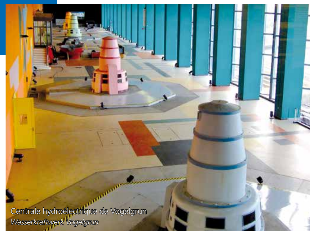
Centrale hydroélectrique de Vogelgrun Wasserkraftwerk Vogelgrun

12 Wasserkraftwerke säumen den Rhein von Basel bis Lauterbourg, entlang der fast 185 Kilometer langen deutsch-französischen Grenze. 10 davon werden von EDF und ihren Tochtergesellschaften betrieben.