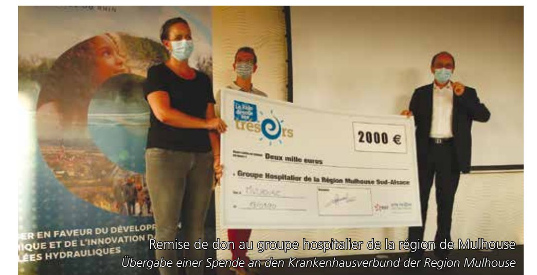
Remise de don au groupe hospitalier de la région de Mulhouse Übergabe einer Spende an den Krankenhausverbund der Region Mulhouse

EDF trägt zur Schaffung von Arbeitsplätzen und zur Innovation in den Bereichen Wasser, Energie und Umwelt bei. Das Unternehmen hat es sich zum Ziel gesetzt, die wirtschaftliche Entwicklung des Rheintals zu unterstützen und seine Dynamik zu fördern, was es mit seinem Programm „Une Rivière, Un Territoire“ in die Tat umsetzt.